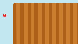
Scherpe zaagranden schuren of licht schaven om voldoende dikte van de verflaag te behouden op de overgang naar de zijkant.